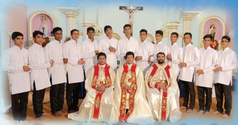
സെന്റ് ജോസഫ് - സെന്റ് തോമസ് പ്രവിശ്യകൾ