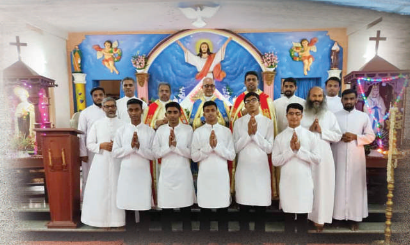
ക്രിസ്തുജ്യോതി - ലിറ്റിൽ ഷർവർ പ്രവിശ്യകൾ