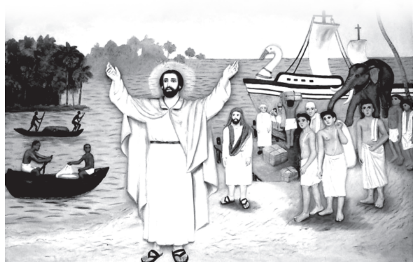
"നമുക്കും അവഭനാടുകുടെ ഭപായി മരിക്കാം."