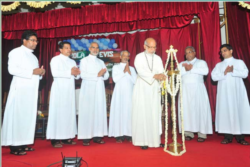
Little Flower Seminary, Aluva