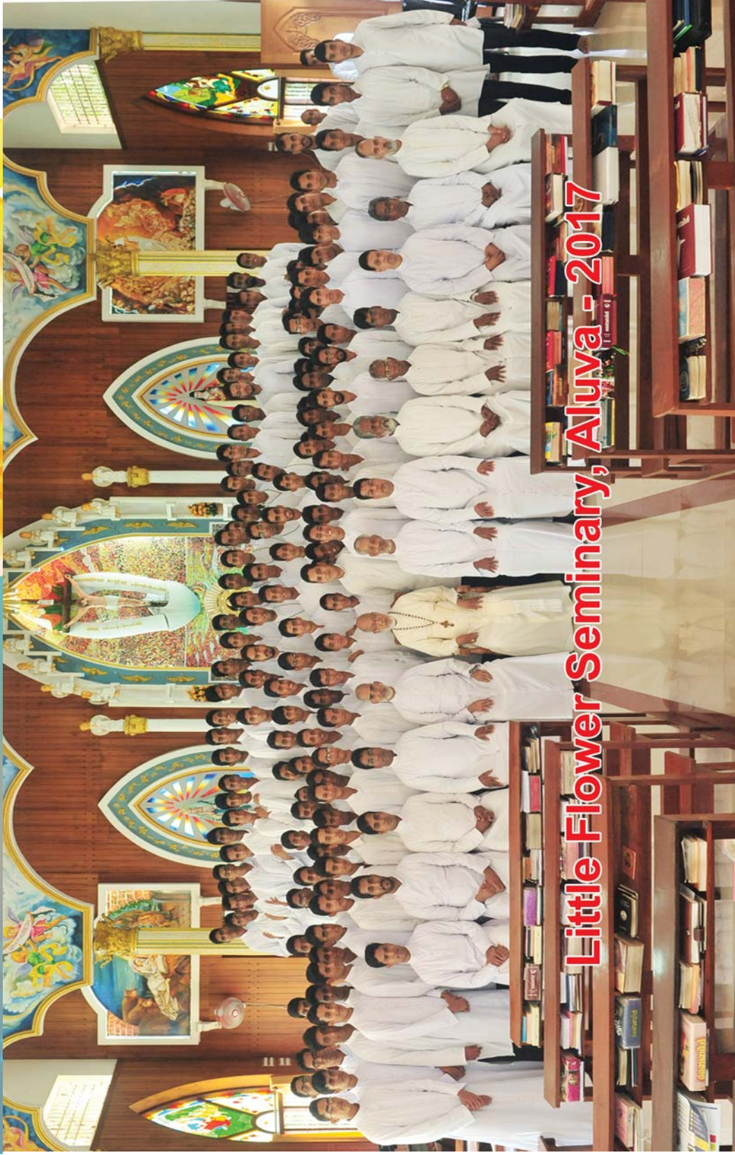
Little Flower Seminary, Aluva - 2017